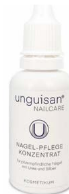
Unguisan Tinktura na nehty více info na straně 22