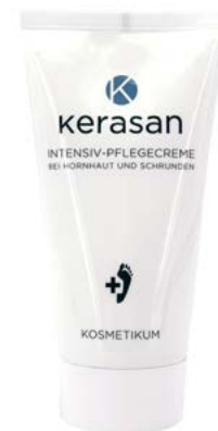
Kerasan krém více info na straně 27