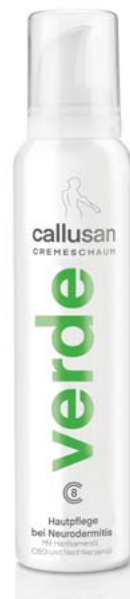
Callusan verde více info na straně 16